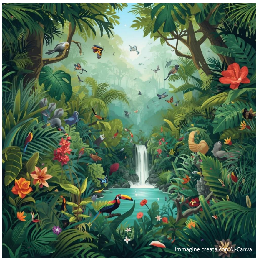
Immagine creata con AI-Canva